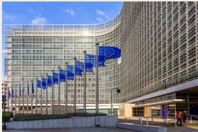
Photographie, site de la Commission européenne