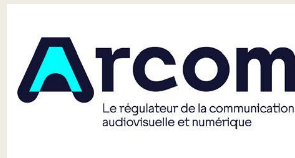
Logo Arcom, site de l'Arcom