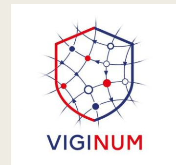
Logo Viginum, site de Viginum